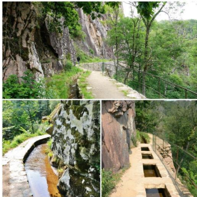
Aubazine et le canal des moines

Tours de merle (63 km) , vestiges médiévaux du 12 e s qui se dressent sur une presqu'île sur la rivière Maronne