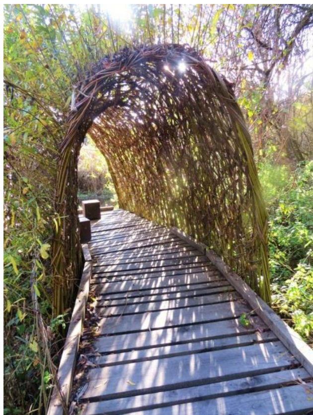
Gloriette en osier vivant au marais du Brézou